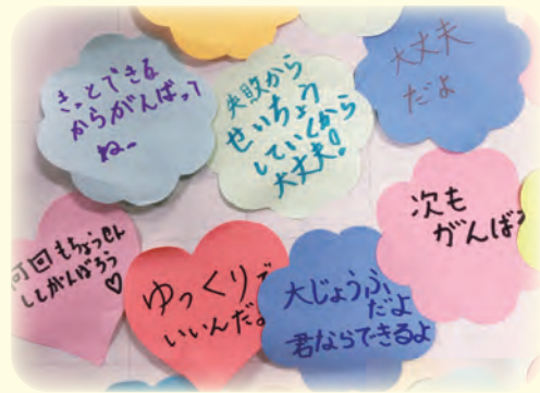
令和5年11月 仙台市PTAフェスティバルにて