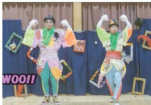
榴岡児童館職員ユニットのボンクラーズのお二人による楽しい歌と踊りの動画

歌と踊りで楽しませていただきました。見たら（聞いたら）動き出さずにはいられなくなる、ユニークな彼らの動画は、コロナ禍の運動不足解消にも役立つかもしれません。親子共々必見です♪