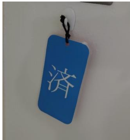
各教室に消毒作業未・済についての表示札