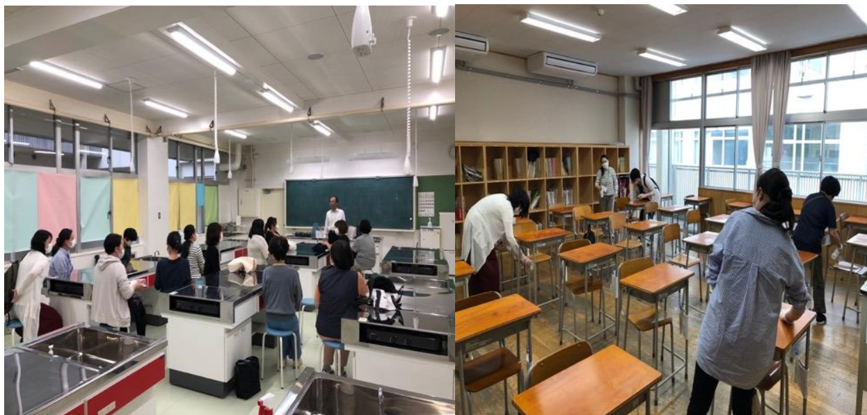
八軒中学校ウイルスバスターズ集合